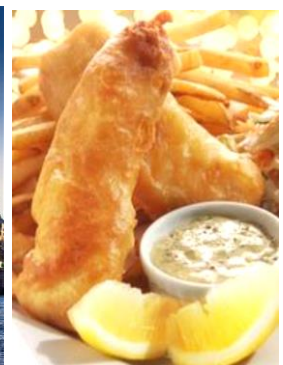
Fish & Chips