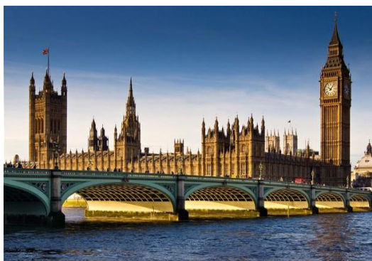
Utsikt från South Bank