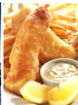
Fish & Chips