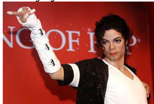
Michael Jackson i vax