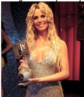
Britney Spears i vax

Vi träffas på Arlanda för att checka in och flyga med Norwegian till London Gatwick där vi landar kl 12.10. Vidare med buss till centrala London där Peter Wik under färden kommer att berätta lite mer om vad vi ska uppleva under de spännande dagarna i London. Med sina drygt 8 miljoner invånare är London Storbritanniens huvudstad som delas i nord-sydlig riktning av floden Themsen med många vackra broar. Vår buss kör på "fel sida" av vägen då man i Storbritannien har vänstertrafik. Så kom ihåg att titta ordentligt till höger innan du går över gatan i London! Vi åker in i centrala London och besöker på eftermiddagen det kända vaxkabinettet Madame Tussauds . Här finns verklighetstroga vaxdockor av kända människor genom tiderna. Vaxkabinettet har funnits här sedan 1884 och grundades av vaxskulptören Marie Tussaud. Vi går och tittar på alla kändisar i vax som är kusligt lika sig själva - i verkligheten. När vi är trötta på vaxdockor åker vi till hotellet och flyttar in i våra fina hotellrum. På kvällen äter vi en middag tillsammans på hotellet innan vi ramlar i säng full av nya intryck. Middag ingår.