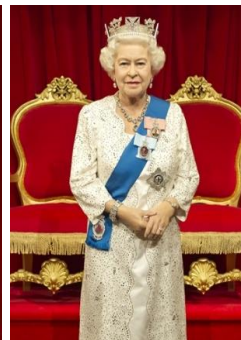
Drottning Elizabeth och Jack Sparrow i vax