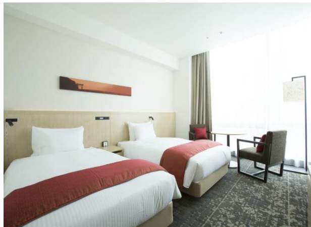
JR Kyushu Hotel Blossom Shinjuku

Pris per person i delat dubbelrum, prenumerant