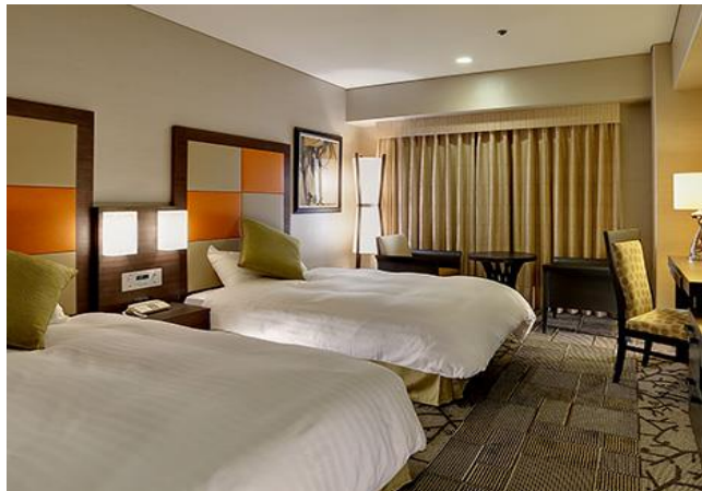
New Miyako Hotel