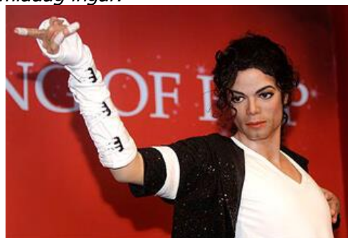
Michael Jackson i vax