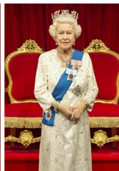
Drottning Elizabeth och Jack Sparrow i vax