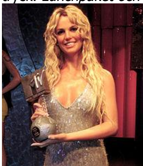
Britney Spears i vax