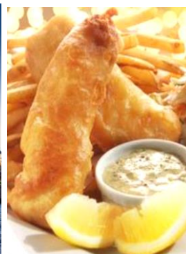
Fish & Chips