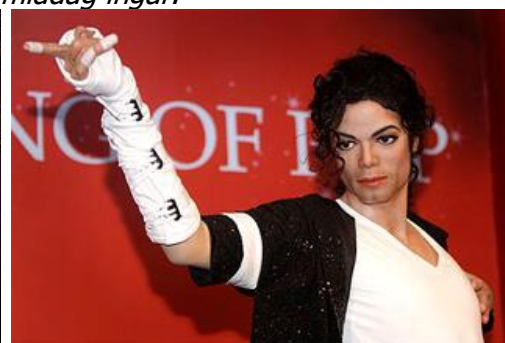
Michael Jackson i vax