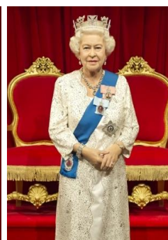
Drottning Elizabeth och Jack Sparrow i vax