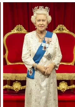
Drottning Elizabeth och Jack Sparrow i vax