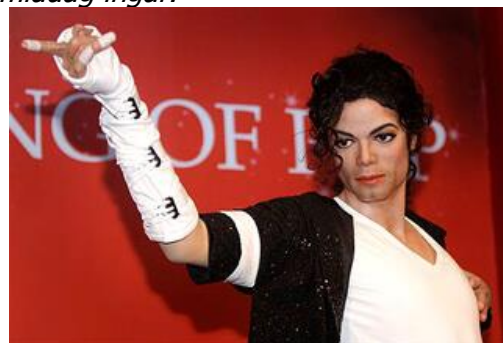
Michael Jackson i vax